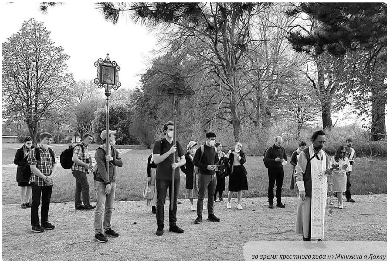
во время крестного хода из Мюнхена в Дахау

шествие могло пройти с соблюдением строгих правил гигиены и в сопровождении полиции (на велосипеде).