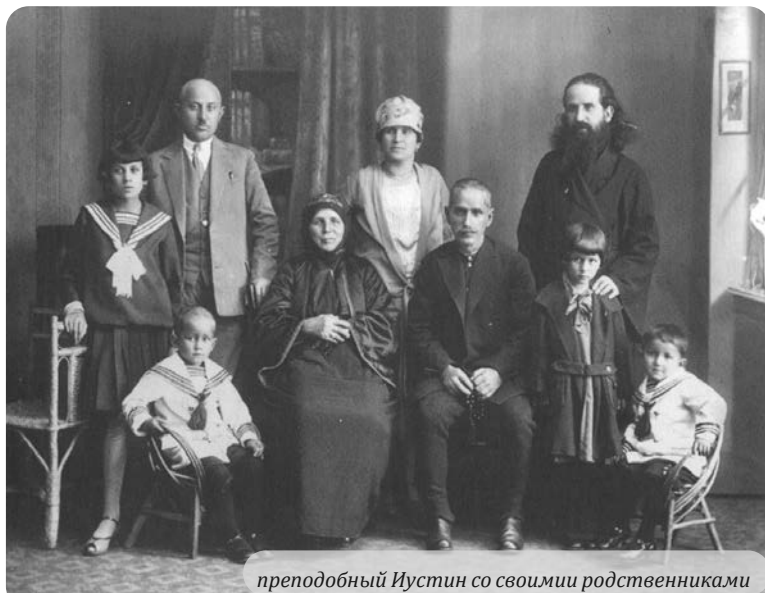
преподобный Иустин со своими родственниками

греху, и тем самым их вечному царству – аду, и царю адскому – Сатане. И они будут наказаны вечной погибелью от лица Господня. Вечной? Да, вечной; потому что человек сотворён Богом для бессмертия и вечности и потому что и всякое зло человека – вечно, и добро человека – вечно. Это основное благовестие Христова Евангелия: все-благовестие, которое Он нам возвестил во время Своей жизни на земле; это и праблаговестие, и праевангелие Его, которое Он обещовал, сотворив человека Бого-образным. И из праевангелия, и из Евангелия Спасителя ясна и очевидна эта истина, эта все-истина о человеке: человек – создание вечное. И знай, всё, что ты делаешь, имеет вечную ценность; всё, о чём думаешь, всё, что чувствуешь, всё, что переживаешь, имеет вечную ценность и определяет твою вечную судьбу. Живя во времени и пространстве, ты вечен и вечно всё, что от тебя: и зло твоё вечно, и добро; зло вечно, потому что погибель вечна; добро вечно, потому что блаженство вечно. Творя зло, ты обрекаешь себя на вечную смерть: смерть, которая бессмертна и всегда жива; её ужас в том, что её жизнь, её бессмертие – вне Бога и всего Божьего, вдалеке от Бога и вообще без Бога. Эта бессмертность и вечность зла: жизнь вне Бога и без Бога, и против Бога и есть мучение, вечное мучение; и это мучение постоянно будет возобновляться, постоянно заново порождаться, и чем дольше оно будет длиться, тем стано-