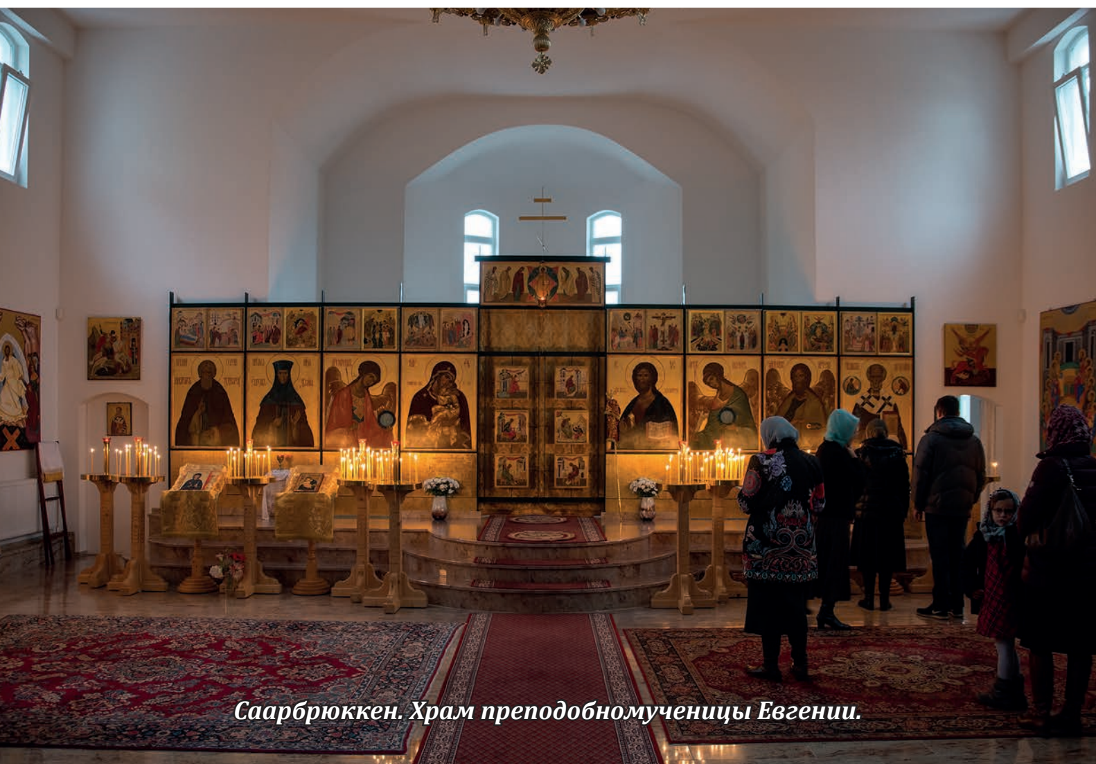
Саарбрюккен. Храм преподобномученицы Евгении.