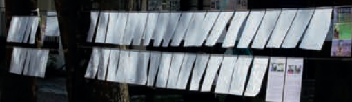
Выставка 1 в мужском монастыре г Мюнхен Дети показывают свои картины письма по тематике смерти