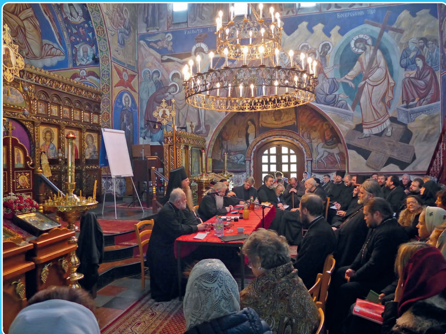
Епархиальный съезд в г. Гамбурге 29.-30.12.2014