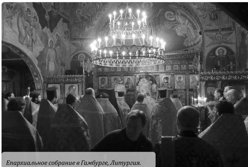
Епархиальное собрание в Гамбурге, Литургия.

Епархиальное собрание под руководством Преосвященной-