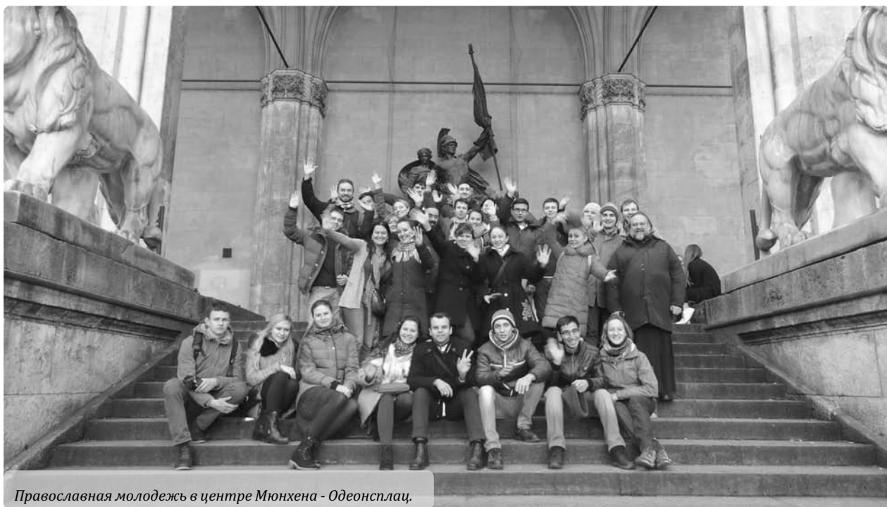
Православная молодежь в центре Мюнхена - Одеонсплац.

скоп Берлинский Марк и как немецкая молодежь помогает украинцам.