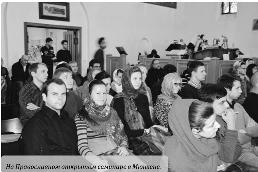
На Православном открытом семинаре в Мюнхене.

о конфликте двух линий русского православия: «нестяжателей» и «иосифлян». Первые следовали пути преп. Нила Сорского и заволжских старцев, коренившемся в молитвенном восприятии монашества и того «умного делания» («тихования», по-гречески «исихии»), которое возродилось в XIV веке во всей Восточной Европе трудами святителя Григория Паламы и преп. Григория Синаита. Тогда же эта молитвенная практика и связанный с нею духовный подход были усвоены преп. Сергием и его учениками, о деятельности которых рассказывал накануне о. Алексей Леммер. Затем этот подход, пребывавший до XVI века достаточно мощным, встретил на Руси совсем другое течение, представленное преп. Иосифом Волоцким и его учениками: монашество понималось ими преимущественно как внешняя дисциплина, трудовая и социальная деятельность с определенной государственно-политической направленностью. Столкновение двух этих течений окончилось плачевно для традиции «тихования»: по этому поводу докладчик выразился весьма скорбно и указал на горькие последствия такого исхода в последующей истории Русской Церкви.