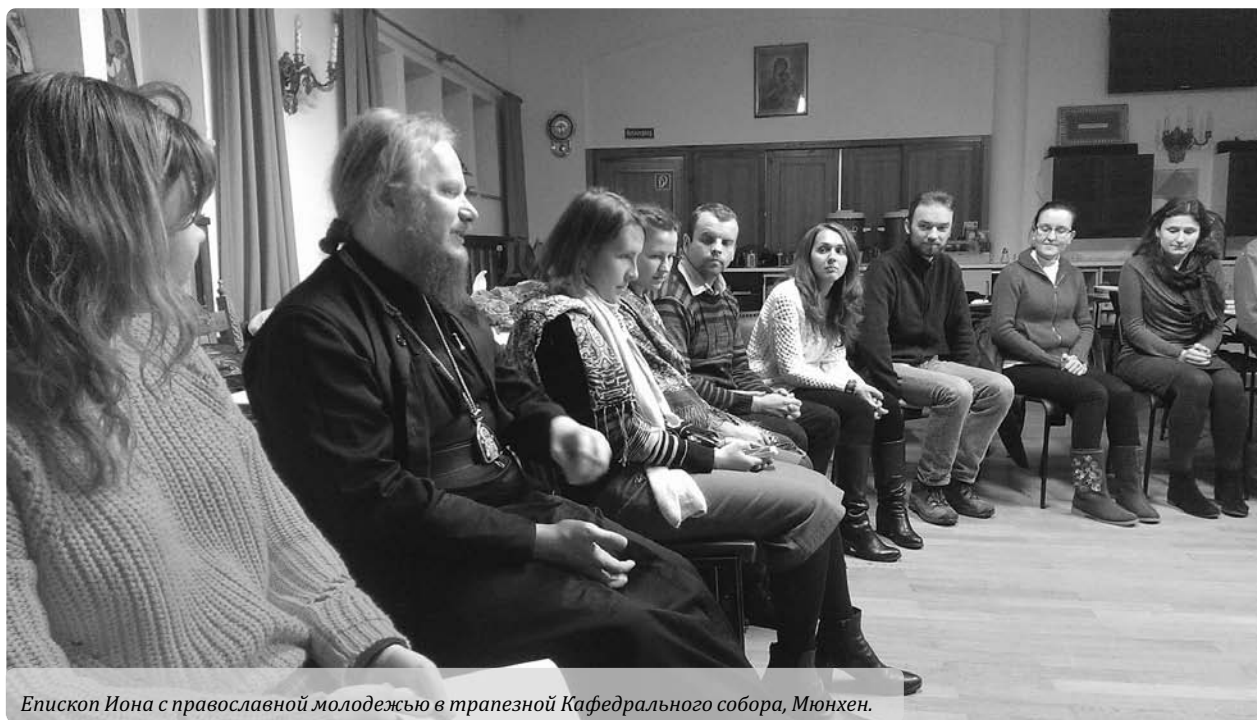
Епископ Иона с православной молодежью в трапезной Кафедрального собора, Мюнхен.

ны здесь располагалось место отдыха для союзнических солдат, и уже после этого здание перешло в пользование монашеской общины преп. Иова Почаевского.