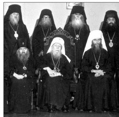
Архиеп. Иоанн, митр. Анастасий, митр. Филарет (1964)

В преддверии этого торжества предлагаем вниманию наших читателей краткую историю РПЦЗ, составленную свят. Иоанном Шанхайским и Сан-Францисским в бытность его архиепископом Брюссельским и Западно-Европейским (печатается, с сохранением некоторых особенностей орфографии, по: Архиепископ Иоанн. Русская Зарубежная Церковь . Женева, 1960.)