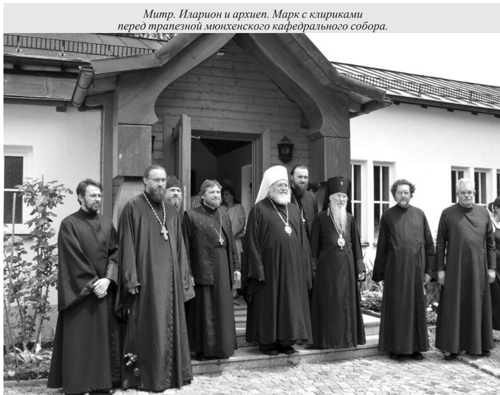
Митр. Иларион и архиеп. Марк с клириками перед трапезной мюнхенского кафедрального собора.

В день преставления и день памяти святителя Иоанна 2 июля (литургия ему служит в ближайшую субботу) – престольный праздник нашего прихода в Карлсруэ – была совершена праздничная литургия, на которую собрались не только прихожане карлсруэвского прихода, но и гости из Баден-Бадена и Мангейма. Богослужение в этот день было по-особенному торжественным и радостным. После ли-