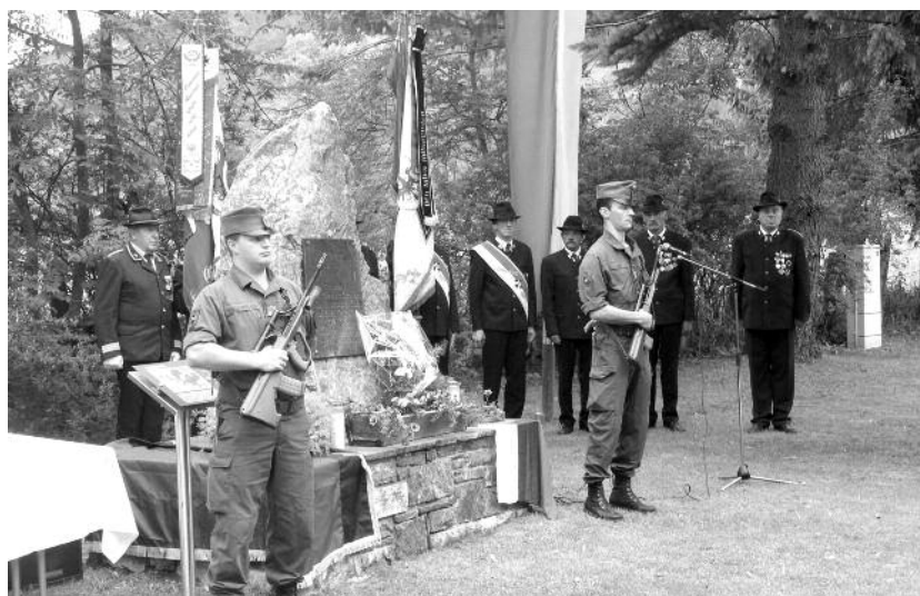
У валуна-памятника, посвященного атаману генералу Гельмуту фон Паннывиту состоялась многолюдная траурная церемония.

Далее, в субботу, 30 мая 2010 года в 9:30 утра у валуна-памятника, посвященного атаману генералу Гельмуту фон Паннывиту, добровольно пошедшему на смерть вместе со своими казаками (казнен на Лубянке), состоялась многолюдная траурная церемония. В этом сельском пригороде Лиенца Тристах, недалеко от деревянного моста, ведущего к казачьему кладбищу, данная встреча прошла с уча-