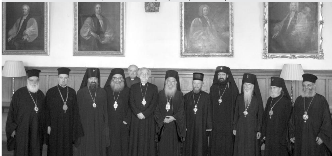
Лондон, 21.06.2010. Участники первого заседания Епископской ассамблеи православных иерархов, имеющих свою каноническую юрисдикцию в Великобритании.