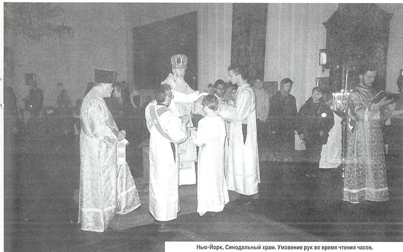
Нью-Йорк, Синодальный храм. Умовение рук во время чтения часов.