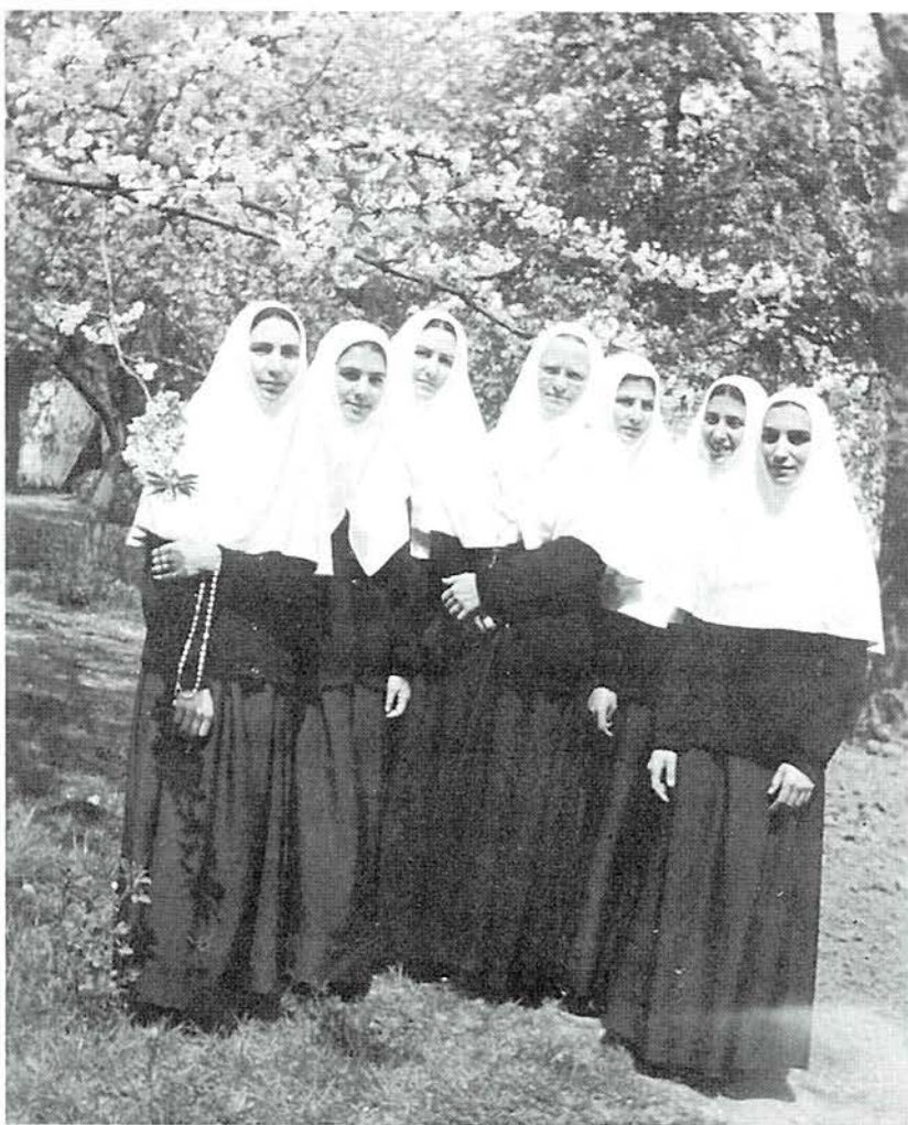
С сестрами в Фуркё (Франция).