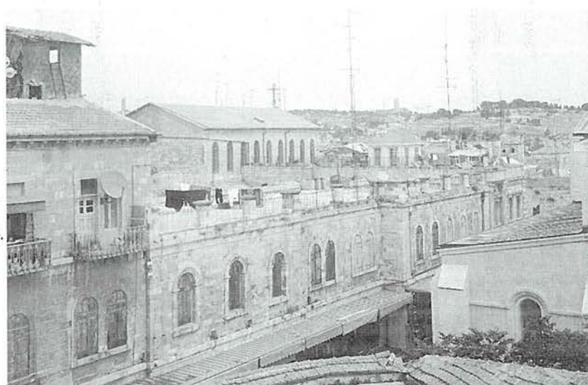
ИЕРУСАЛИМ. ХРАМ СВ. АЛЕКСАНДРА НЕВСКОГО (на раскопках). Внешний и внутренний вид.