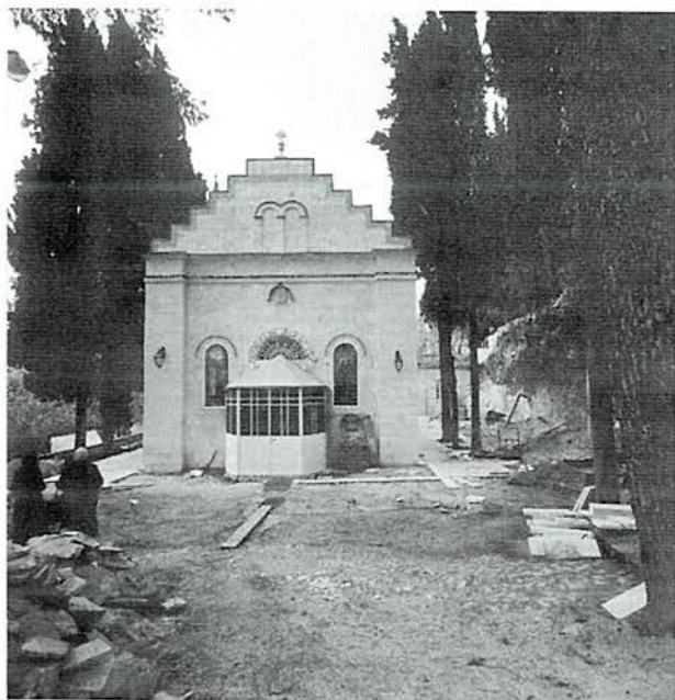
ИЕРУСАЛИМ. ГОРНЕНСКИЙ МОНАСТЫРЬ