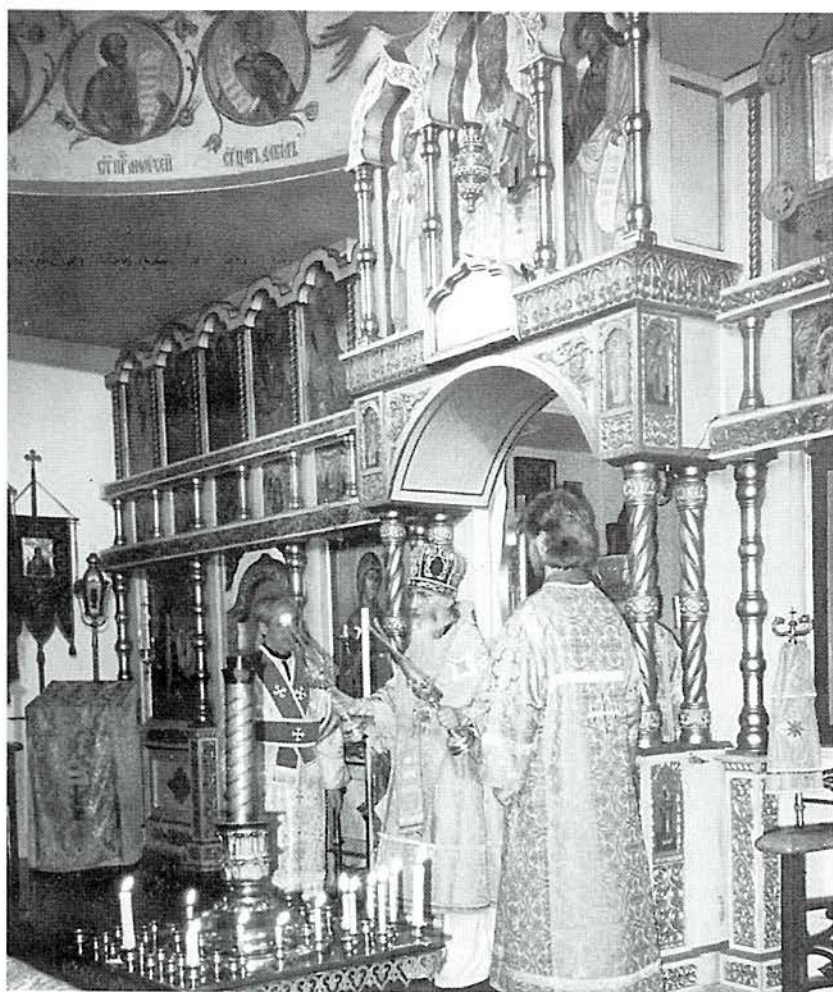
Нью-Йорк: Литургия в Синодальном храме