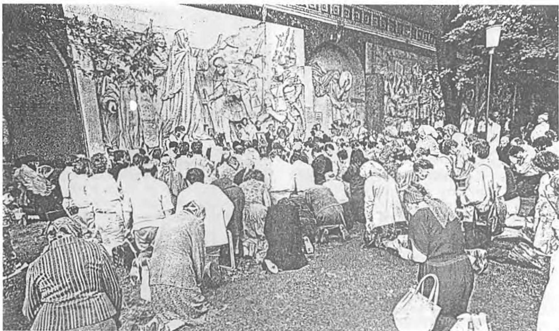
Молебен в Донском монастыре у горельефа сохранившегося от разрушенного храма Христа Спасителя. На горельефе: преп. Сергий благословляет благоверного князя Дмитрия Донского на бой с татарами. Духовой оркестр молодых членов консерватории.