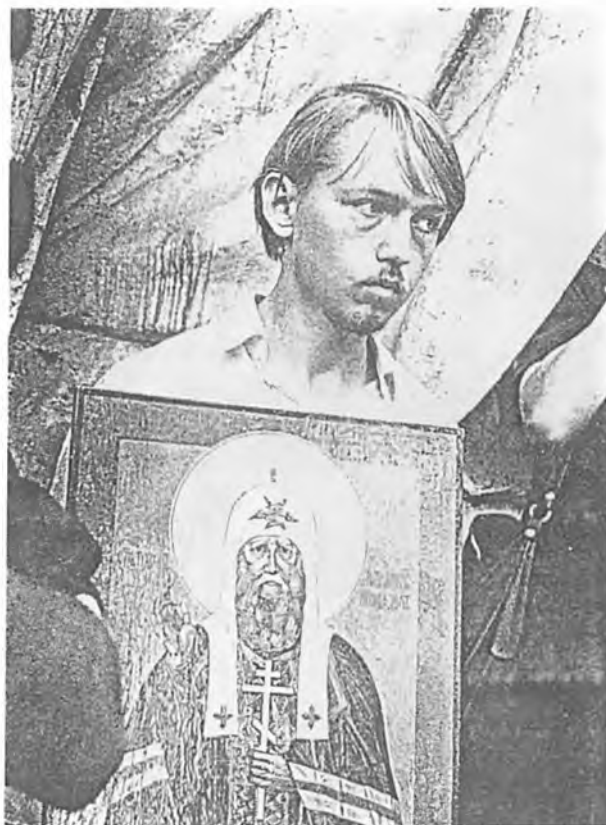
Икона Св. Патриарха Тихона исповедника, издана Русской Зарубежной Церковью после прославления в 1981 году.