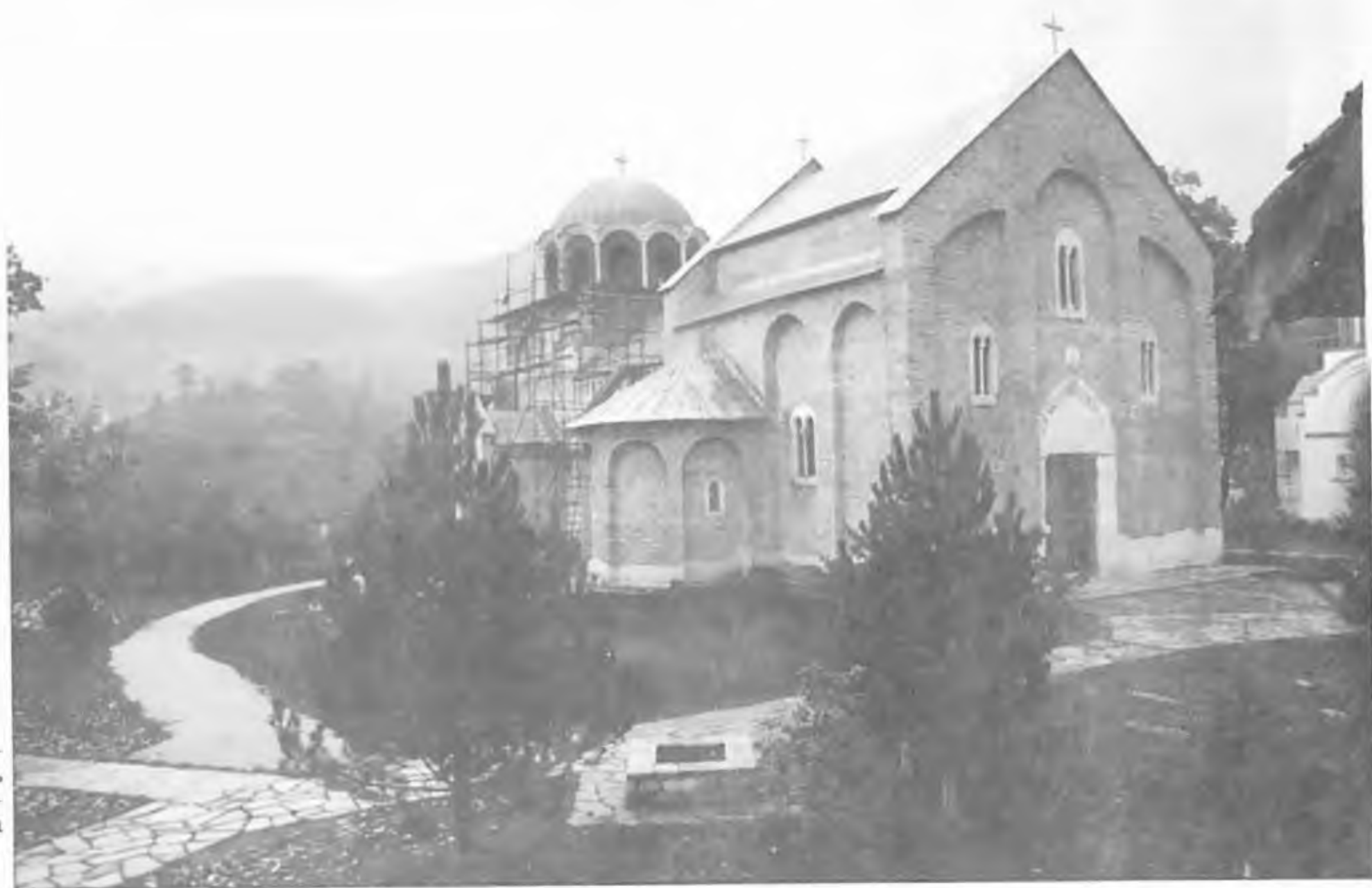
Монас- тырь Студе- ница