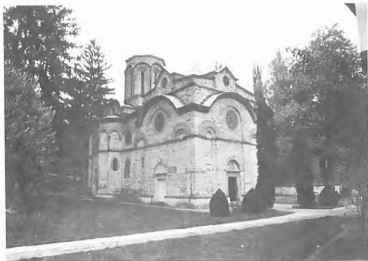
Монас- тырь Лю- бостыня