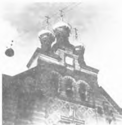
1000-летие Крещения Руси

Вы прочтете о российских Святых – до Св. Иоанна Кронштадтского и Новомучеников, об Оптиной пустыни, Лаврах и монастырях, о Миссии, о русских писателях и философах... Книжка крепко сброшюрована и хороша для посылки в Россию (см. ниже).