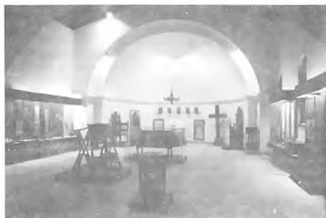
Музей монастыря; внизу справа - рака св. Стефана, короля Сербского, пожертвованная императрицей Екатериной II.