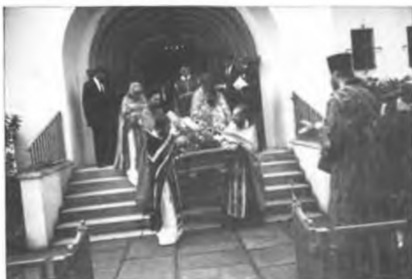
Отпевание в Гамбурге

В воскресенье 27-го сентября, после обеда, гроб с покойным владыкой был привезен в Свято-Прокопиевский храм в Гамбурге, где с того момента непрестанно служились панихиды и читалось Св. Евангелие священнослужителями нашей Епархии. Поздним вечером прибыл из Мюнхена Преосвященный Марк, Епископ Берлинский и Германский.