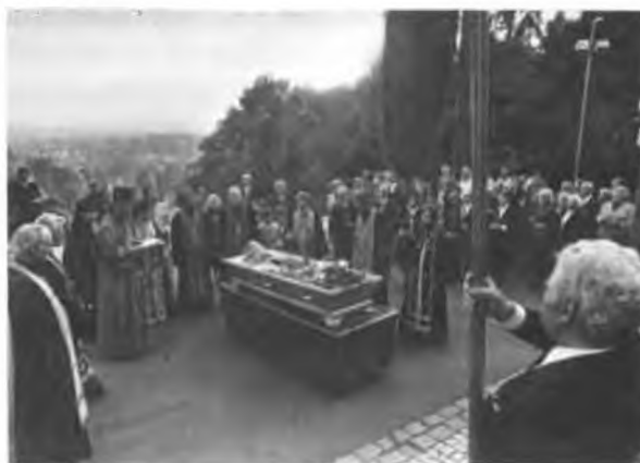
...душу раба твоего, Спасе, упокой...

Зарубежной Церкви — Владыка Митрополит Филарет.