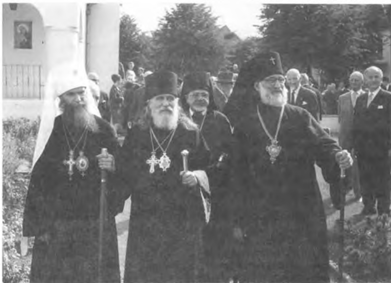
Освящение храма св. Прокопия в Гамбурге 1965. Митрополит Филарет Архиепископ Филофей и Архиепископ Александр.

В 1953 г. владыка Филофей переводится на кафедру Управляющего Северо-западным Викариатством в Гамбурге. Здесь он вскоре строит