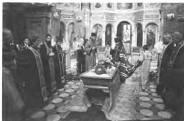
См. души праведных скончавшихся.

ятельности, владыку в 1981 г. награждают государственным орденом первой степени ФРГ.