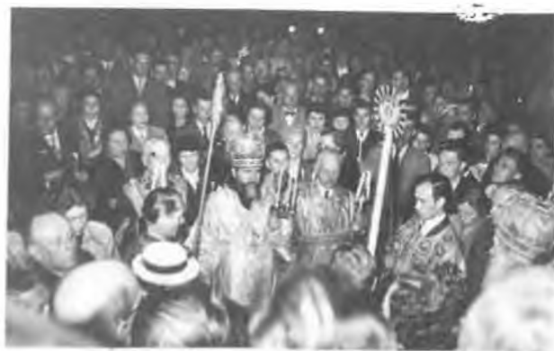
Пасха в Витебске, 1950 г.

Во время войны владыка Филофей неустанно трудится при восстановлении церковной жизни на ставших свободными от коммунистического гнета территориях: рукополагает священников по всей Белоруссии, крестит, венчает, поучает.