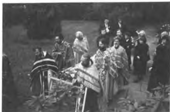
...и память их в род и род.