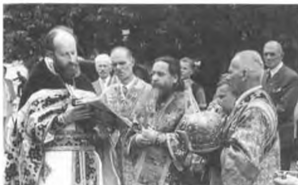
Архиепископ Филофей и Протонерей Леонид Игнатьев. Бад Гамбург 1950 г.

В 1946 г. был принят в состав Русской Православной Церкви Заграницей Собором Епископов вместе с другими иерархами Белорусской Церкви.