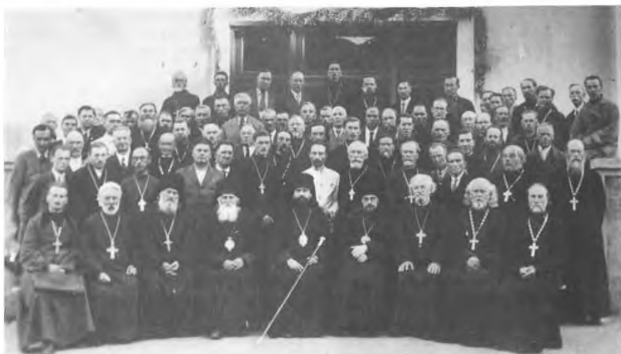
Православный Всебелорусский Церковный Собор. Минск 1942 г. В середине - Архиепископ Филофей, слева - Епископ Стефан (Севбо) и справа - Епископ Афанасий (Мартом)

то-Успенском монастыре 10/23 ноября 1941 г., собором епископов Белорусской Церкви. 9 марта 1942 г. он назначается на кафедру Епископа Могилевского и Мстиславского, а с 10 марта того же года ему поручается временное управление Митрополией Минской Епархией (до хиротонии Епископа Стефана). В 1942 г. возведен в сан Архиепископа за труды по организации Православной Белорусской Церкви. Декретом Митрополита Минского и всей Белоруссии, Пантелеймона, самостоятельно управлял Белорусской Митрополией.