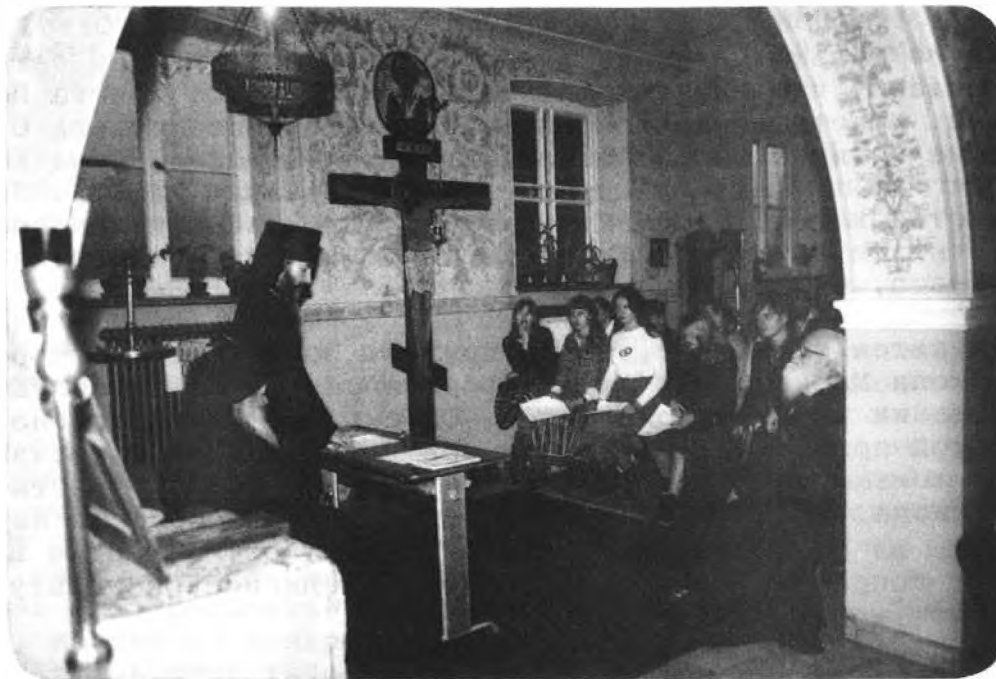
НАЧАЛО СЪЕЗДА: Доклад Епископа Марка . На переднем плане: Архиепископ Нафанаил, Епископ Марк, Архимандрит Феодор.